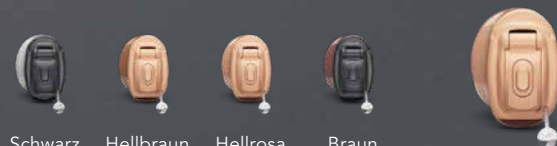
Schwarz Hellbraun Hellrosa Braun