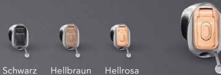
Schwarz Hellbraun Hellrosa