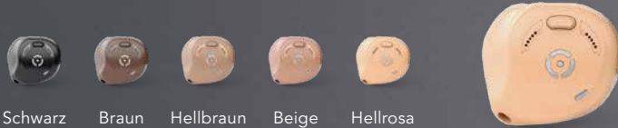
Schwarz Braun Hellbraun Beige Hellrosa